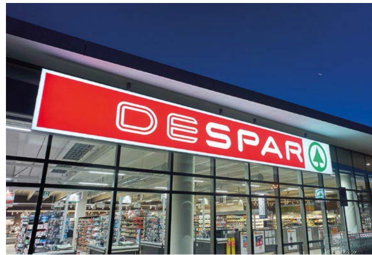
SPAR ist ein mitteleuropäischer Handelskonzern.

Zur SPAR Österreich-Gruppe gehört auch Österreichs größter Entwickler, Errichter und Betreiber von Shopping-Centern: SES Spar European Shopping Centers. Das 2007 gegründete Unternehmen managt 29 Shopping-Standorte in sechs Ländern in Zentral-, Süd- und Osteuropa. SES ist im Geschäftsfeld großflächige Shopping-Center Marktführer in Österreich und in Slowenien. Das Know-how in den Bereichen Projektentwicklung, Bau- und Facility-Management bietet SES auch als Dienstleistung an. SES-Center wurden bereits mehrfach hinsichtlich Architektur und Design, Nachhaltigkeit, Verkehrskonzeption und innovatives Marketing national und international ausgezeichnet. Weitere Informationen ab Seite 50.