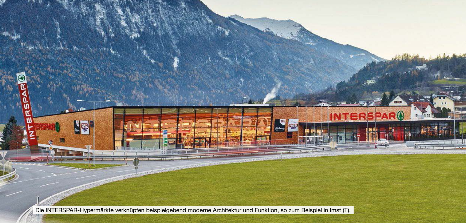
Die INTERSPAR-Hypermärkte verknüpfen beispielgebend moderne Architektur und Funktion, so zum Beispiel in Imst (T).