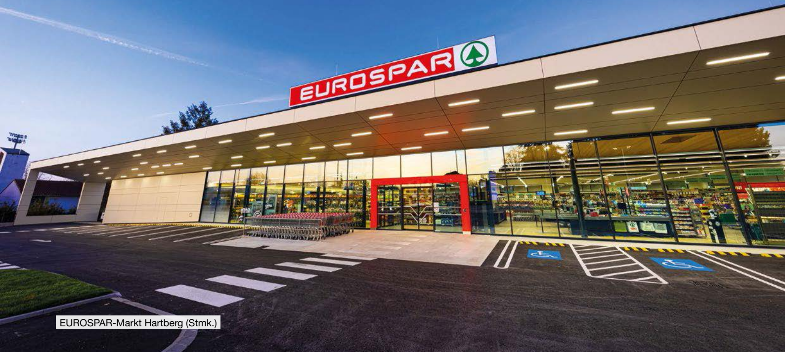
EUROSPAR-Markt Hartberg (Stmk.)