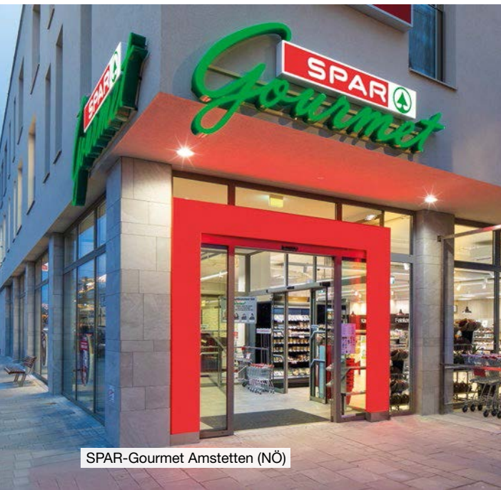
SPAR-Gourmet Amstetten (NÖ)