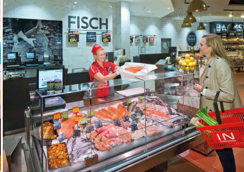
Zuckerreduktion, Palmölfreiheit und verantwortungsvoll gefangener oder gezüchteter Fisch: Das ist SPAR neben vielen weiteren CSR-Themen wichtig.