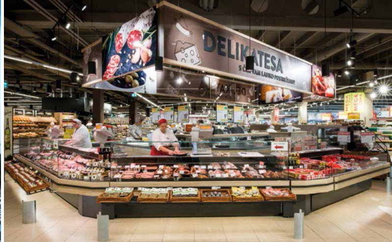
INTERSPAR in Ljubljana-Vič (SI)