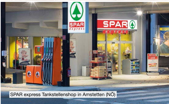
SPAR express Tankstellenshop in Amstetten (NÖ)