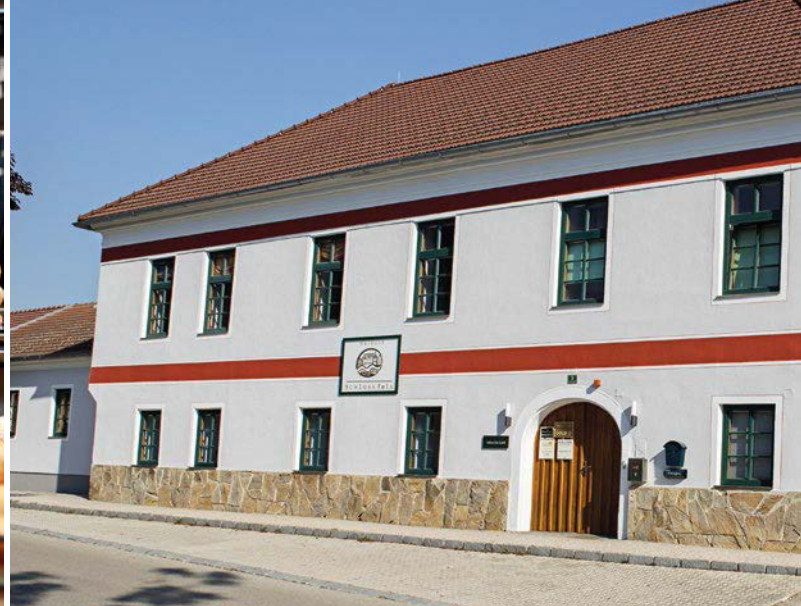
Das WEINGUT SCHLOSS FELS produziert hochwertige Qualitätsweine.