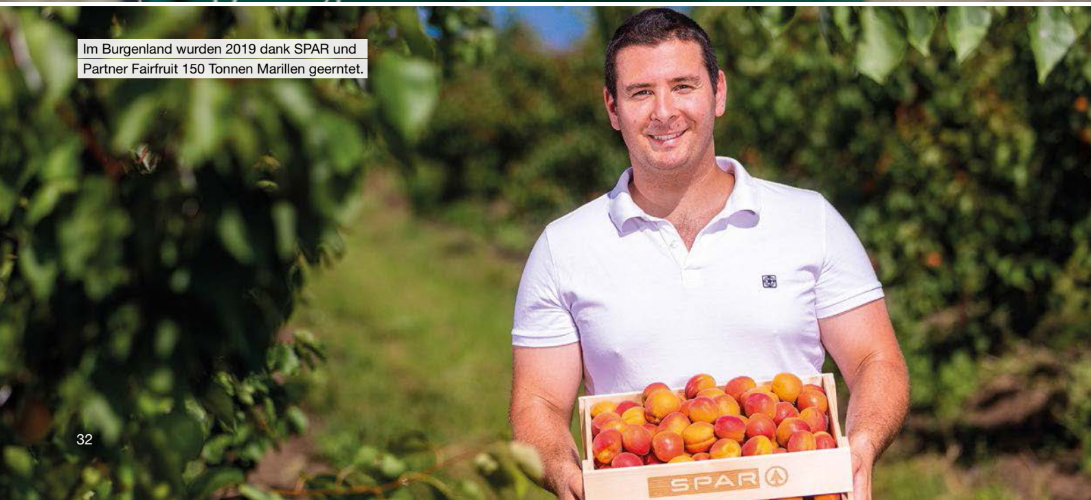
Im Burgenland wurden 2019 dank SPAR und Partner Fairfruit 150 Tonnen Marillen geerntet.