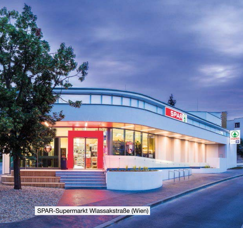
SPAR-Supermarkt Wlassakstraße (Wien)

Der SPAR-Supermarkt in der Wlassakstraße (Wien) wurde 2019 mit dem „SCHORSCH“, dem Architekturpreis der Stadt Wien, ausgezeichnet.