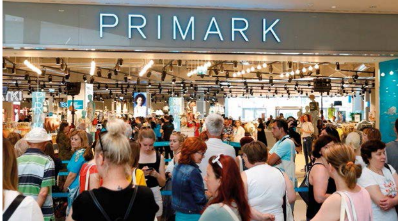
Primark im CITYPARK Ljubljana (SI)