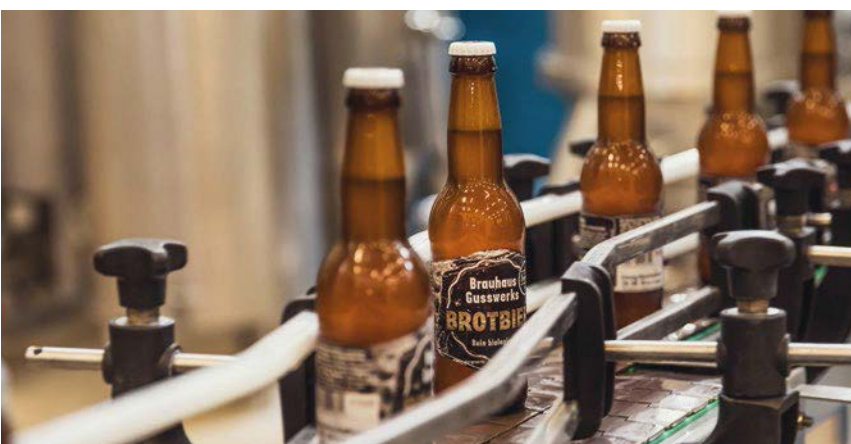
Zeichen gegen Lebensmittelverschwendung: das ausgezeichnete Bio-Brotbier