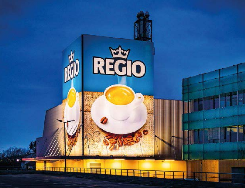
REGIO-Kaffee steht für besten Kaffeegenuss aus Österreich.