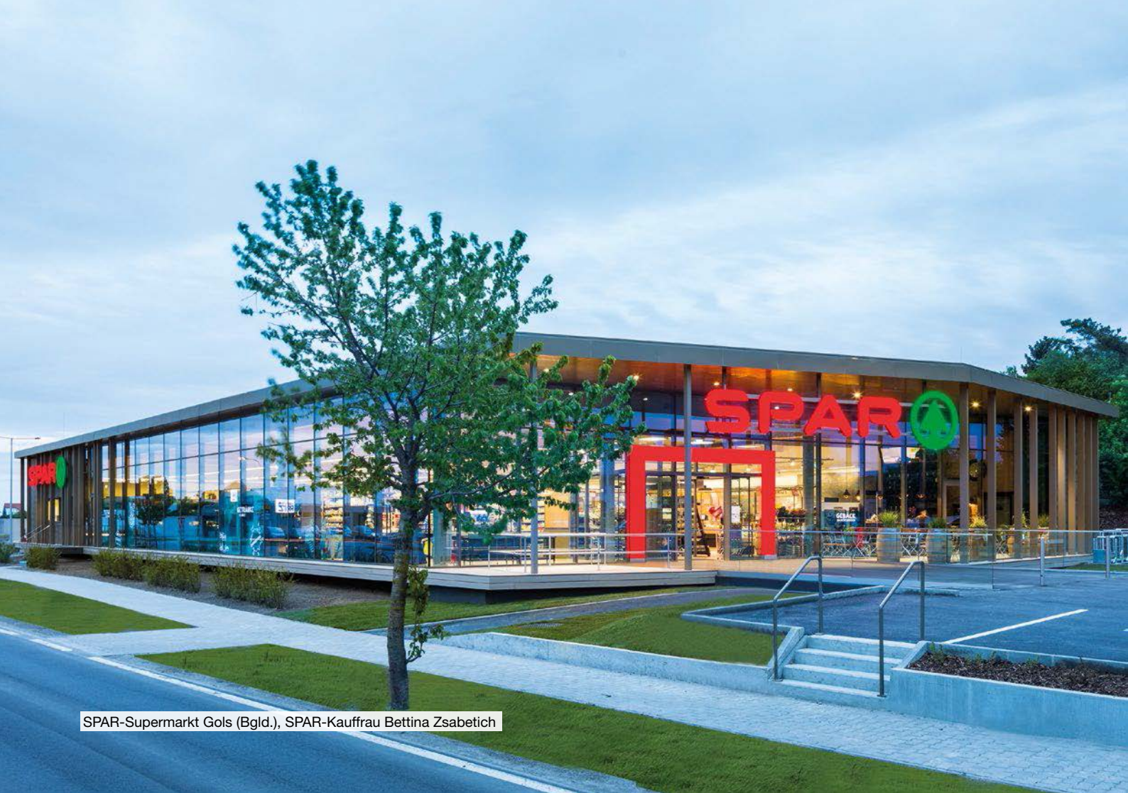
SPAR-Supermarkt Gols (Bgl.), SPAR-Kauffrau Bettina Zsabetich