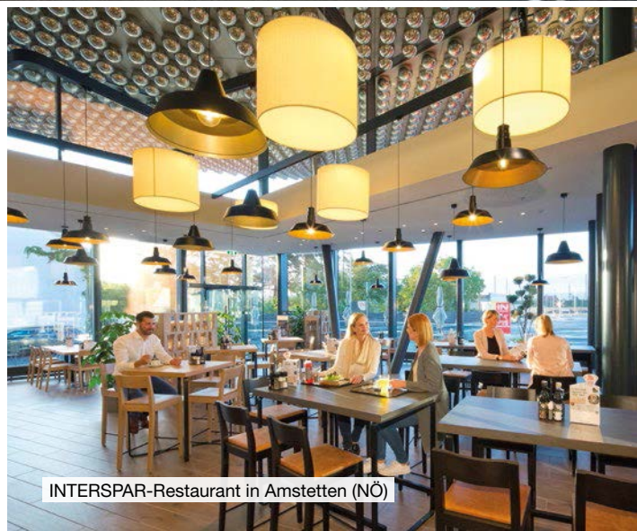
INTERSPAR-Restaurant in Amstetten (NÖ)

2002 hat INTERSPAR Maximarkt übernommen. Die insgesamt sieben Maximarkt-Familienmärkte in Oberösterreich und Salzburg bieten auf bis zu 5.000 m 2 ein besonders großes regionales Sortiment. Für die Beibehaltung der regional stark verankerten Marke Maximarkt hat sich INTERSPAR bewusst entschieden.