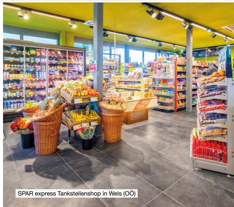
SPAR express Tankstellenshop in Wels (OÖ)