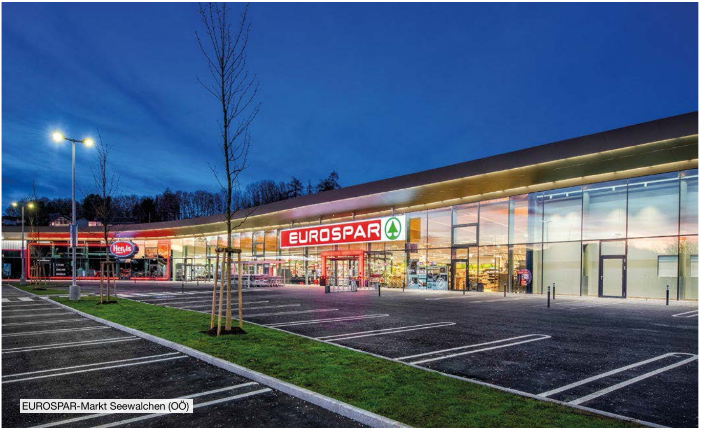
EUROSPAR-Markt Seewalchen (OÖ)