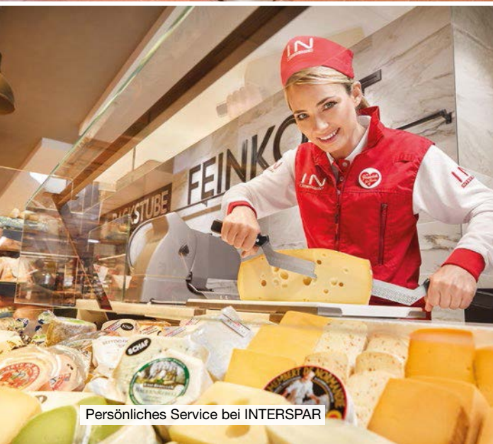
Persönliches Service bei INTERSPAR