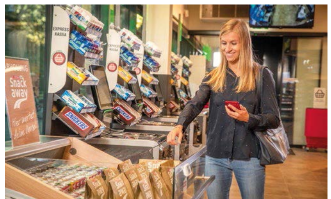
Beliebt bei den Studierenden: die Snack away Jausen-App

Auf Basis der Erfahrungen im SPAR-Supermarkt am Campus der Wirtschaftsuniversität Wien wurde der neue SPAR-Supermarkt der Linzer Johannes Kepler Universität mit diversen technischen Highlights, wie moderne Kassentechnik oder digitale Preisauszeichnung, ausgestattet. Über die Snack away Jausen-App kann die Jause vorbestellt und im Markt abgeholt werden.