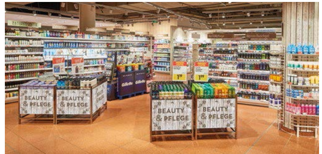
Die neue Abteilung Beauty & Pflege im EUROPARK Salzburg

In der Abteilung Beauty & Pflege wird ein neues Einkaufserlebnis geschaffen: Die warme Holzoptik der Möbel und der Ummantelungen sowie die Beleuchtung sorgen für eine angenehme Atmosphäre. Seit August 2019 wird das neue Konzept im INTERSPAR-Hypermarkt im EUROPARK Salzburg getestet, ab 2020 wird es national ausgerollt.