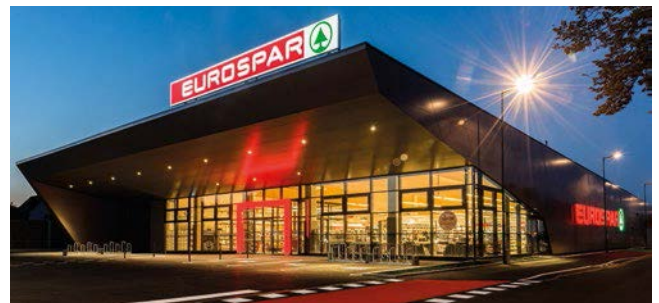
EUROSPAR-Markt Tulln (NÖ)

Das Kerngeschäft von SPAR ist und bleibt der Lebensmittelhandel in Österreich. Mit rund 1.560 Standorten versorgt SPAR das ganze Land täglich mit besten Lebensmitteln. Von Vorarlberg bis ins Burgenland gibt es kaum eine Gemeinde, in der SPAR nicht vertreten ist. Sowohl in den großen Städten als auch in den nur wenige Hundert Einwohner zählenden Gemeinden trägt SPAR maßgeblich zur flächendeckenden modernen Nahversorgung Österreichs bei.