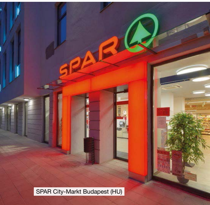
SPAR City-Markt Budapest (HU)

SPAR-Supermärkte sind moderne, vollsortierte Nahversorger mit einem großen Frischebereich. Auf einer Fläche bis zu 1.000 m 2 bietet der SPAR-Supermarkt ein umfassendes Sortiment, professionelles Kundenservice sowie attraktive Preisvorteile. SPAR-Supermärkte gibt es außer in Österreich auch in Slowenien, Ungarn und Kroatien. SPAR-Supermärkte sind entweder Eigenfilialen von SPAR oder sie werden von selbstständigen SPAR-Kaufleuten geführt.