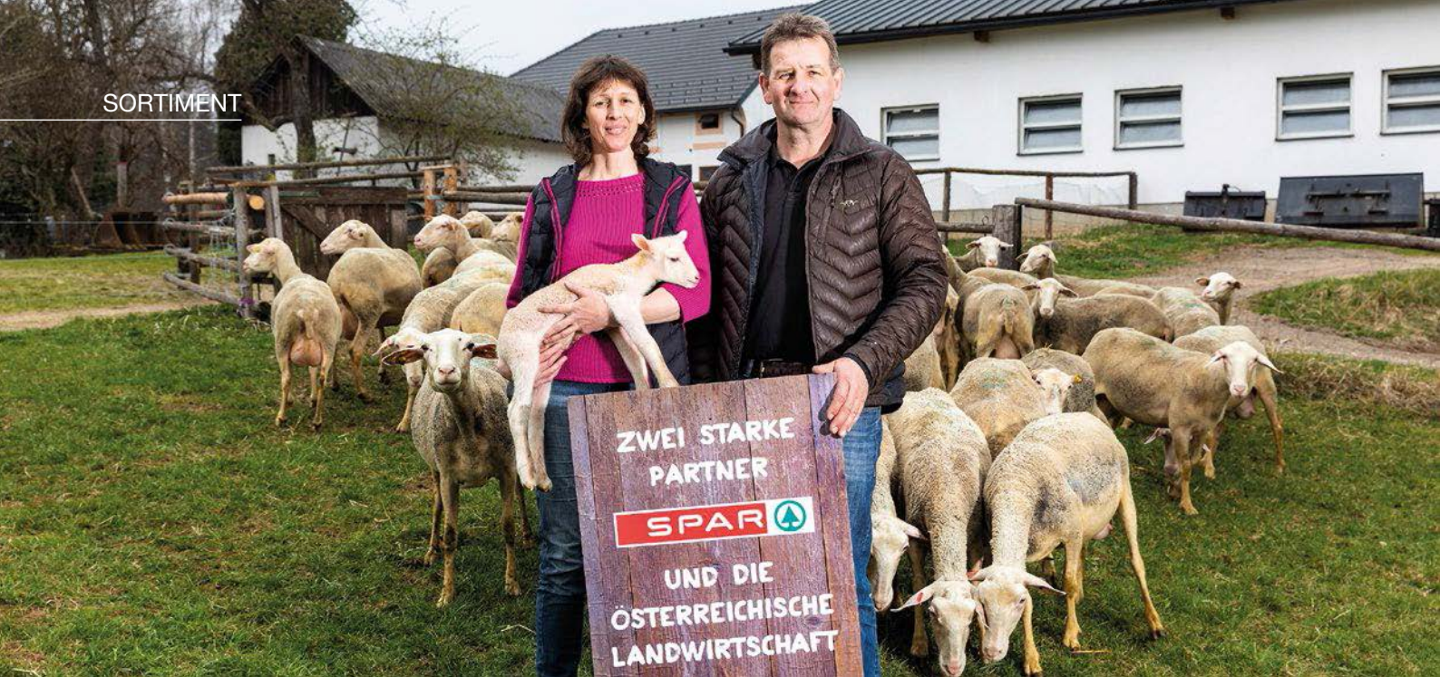
Lokale Erzeugung, Sicherung von Arbeitsplätzen in der Region und Wertschöpfung in Österreich: Darauf legt SPAR Wert.