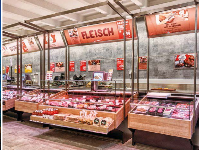
TANN ist Österreichs größter Fleischverarbeiter und Wurstwarenproduzent.