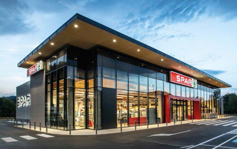
SPAR-Supermarkt in Mozirje (SI)