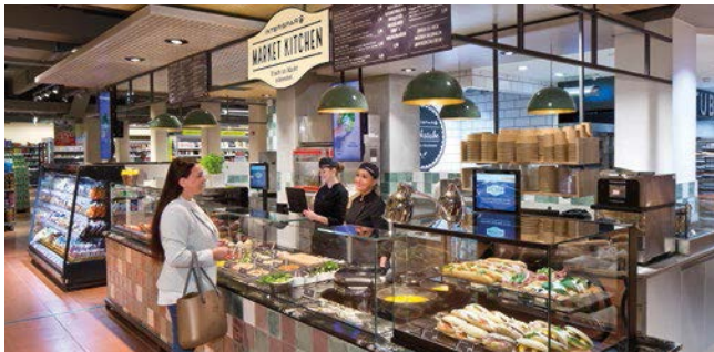
Die erste INTERSPAR-Market Kitchen feierte in Bregenz Premiere.

In der INTERSPAR-Market Kitchen werden den Kundinnen und Kunden frisch im Markt zubereitete Gerichte zum Mitnehmen angeboten. Nach dem Front-Cooking-Prinzip bereiten die Mitarbeitenden warme und kalte Gerichte im Herzen des Hypermarktes zu. Für 2020 sind weitere Standorte in Planung und in Umsetzung.