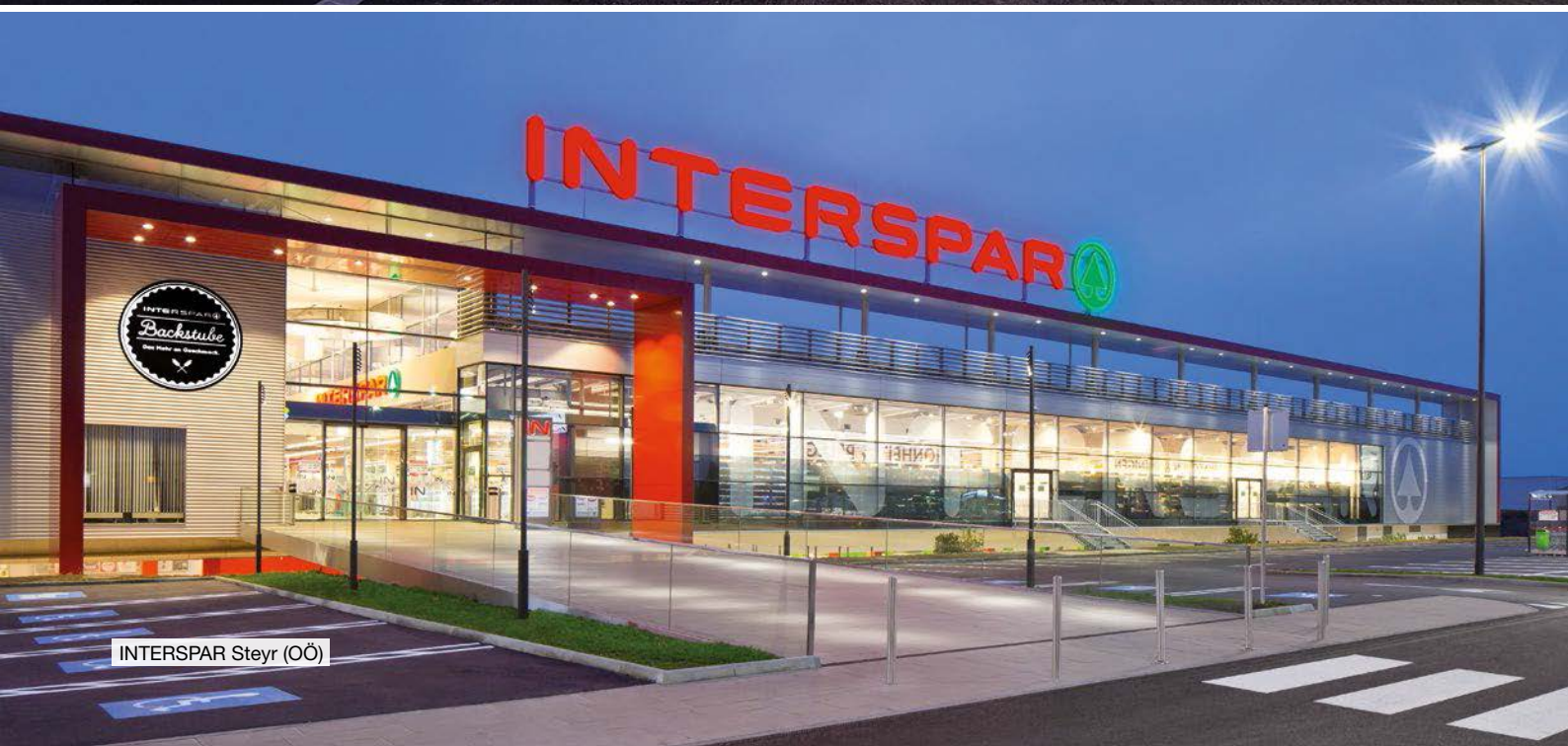
INTERSPAR Steyr (OÖ)