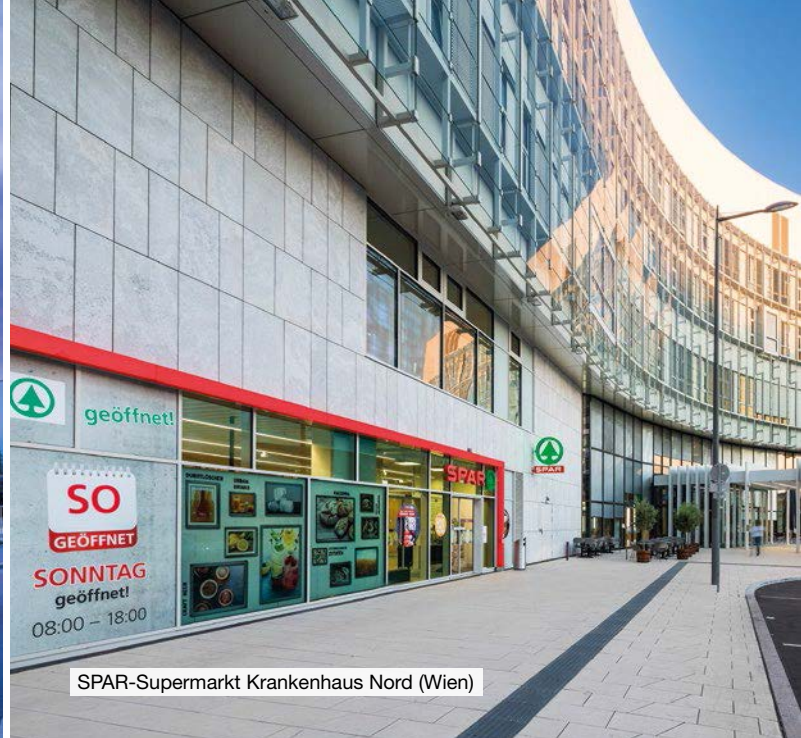
SPAR-Supermarkt Krankenhaus Nord (Wien)

Der SPAR-Supermarkt in der Wlassakstraße (Wien) wurde 2019 mit dem „SCHORSCH“, dem Architekturpreis der Stadt Wien, ausgezeichnet.