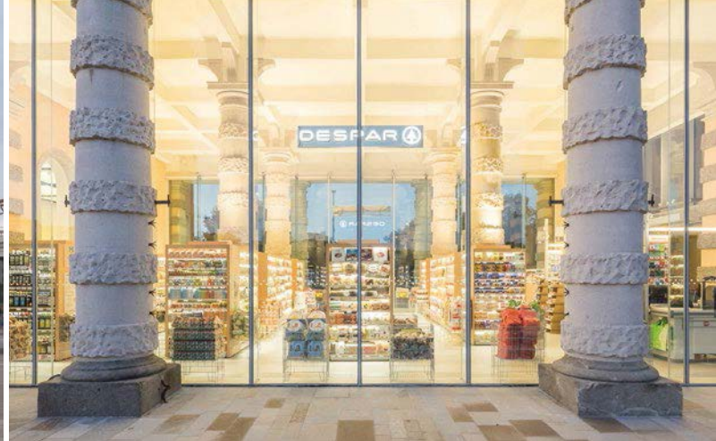
Der neue DESPAR-Supermarkt im historischen Gebäude am Prato della Valle in Padua (IT) ist ein architektonisches Highlight.