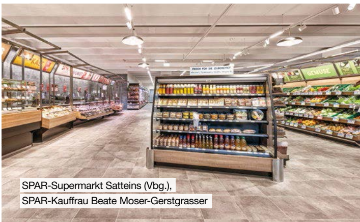
SPAR-Supermarkt Sattels (Vbg.), SPAR-Kauffrau Beate Moser-Gerstgrasser