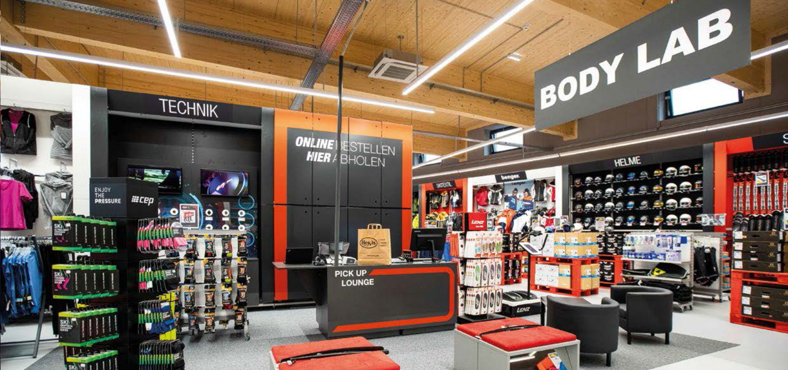
Hervis setzt mit den „Body Lab-Kompetenzzentren“ auf individuell angepasste Sportausrüstungen.