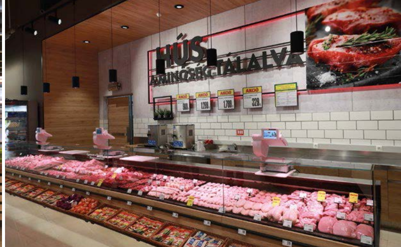
In Tata eröffnete der 34. INTERSPAR-Hypermarkt Ungarns.