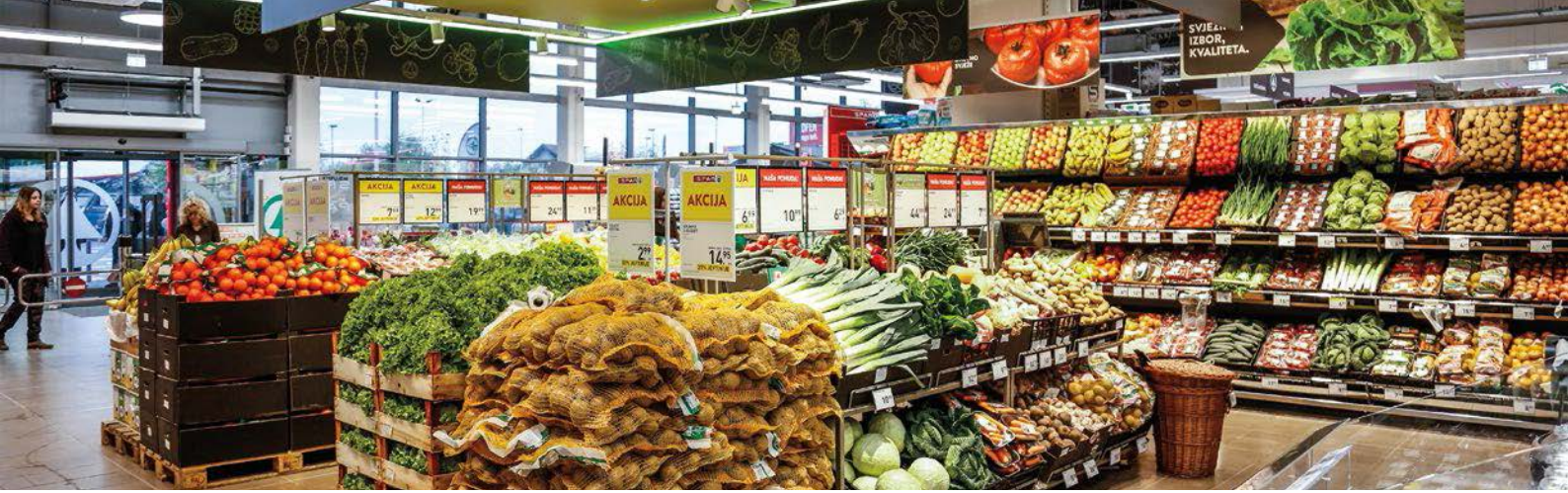
SPAR Kroatien punktet mit einer großen Sortimentsvielfalt und vielen regionalen Produkten.