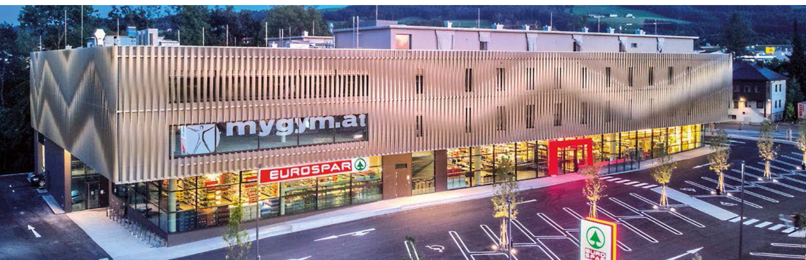
EUROSPAR-Markt Eugendorf (Sbg.)