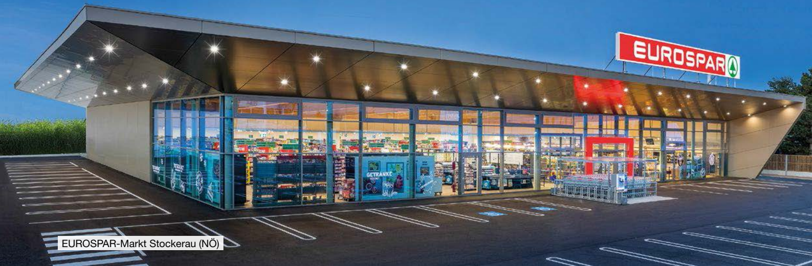
EUROSPAR-Markt Stockerau (NÖ)

EUROSPAR-Märkte bieten auf einer Verkaufsfläche von 1.000 bis 2.000 m 2 ein preisattraktives Angebot an frischen Lebensmitteln sowie Nonfood-Produkten. EUROSPAR-Märkte können entweder als Stand-alone-Märkte, als Teil einer Fachmarktzeile oder in einem Shopping-Center umgesetzt werden. Außer in Österreich gibt es EUROSPAR-Märkte auch in Italien.