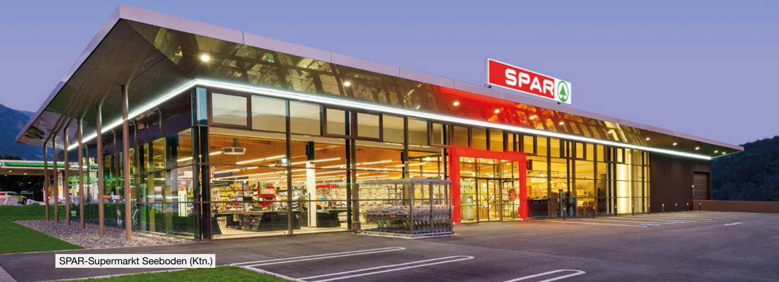
SPAR-Supermarkt Seeboden (Ktn.)