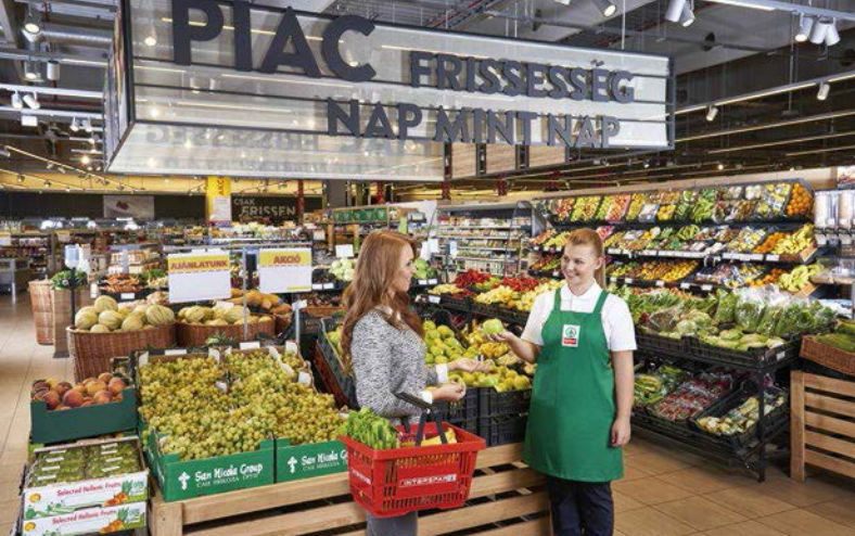
SPAR Ungarn wurde als Toplebensmittelhändler mehrfach prämiert.