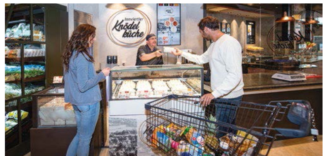
Die „Innviertler Knödelküche“ im Maximarkt Ried im Innkreis (OÖ)

2019 wurde mit der Rundumerneuerung von gleich fünf INTERSPAR-Standorten gestartet: In Alt-Erlaa (Wien), Braunau (OÖ), Bregenz (Vbg.), in der PlusCity Pasching