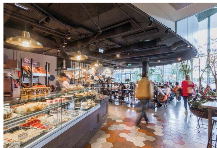
„The Bakery by Didi Maier“ im EUROPARK Salzburg