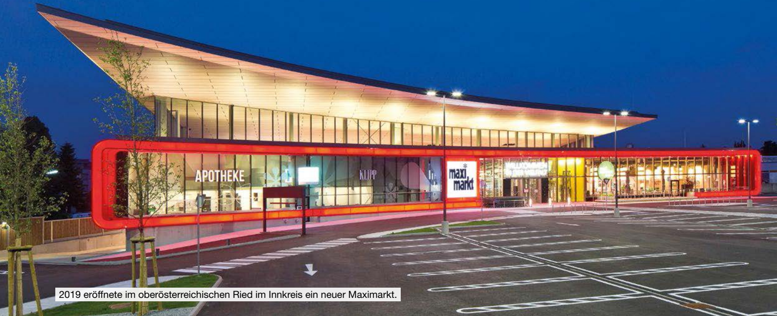
2019 eröffnete im oberösterreichischen Ried im Innkreis ein neuer Maximarkt.