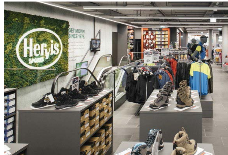
Auf Wachstumskurs: Sportspezialist Hervis