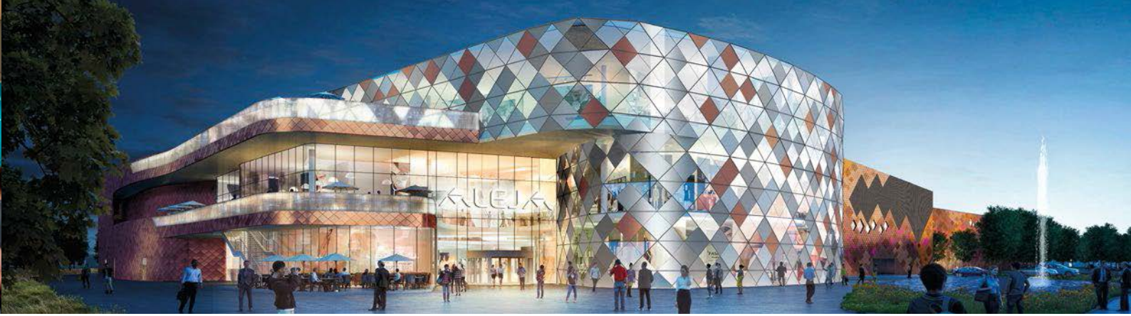
Visualisierung des neuen Shopping-Centers ALEJA in Ljubljana (SI)

und Maximarkt-Standorte im Konzern ein Energiemanagementsystem nach EN ISO 50001:2018 ein, das durch den TÜV AUSTRIA zertifiziert wurde. SES verpflichtet sich, einen noch stärkeren Beitrag zum Klimaschutz durch nachhaltige Immobilienentwicklung zu leisten. Besonders im Fokus steht der Ausbau der Photovoltaik.