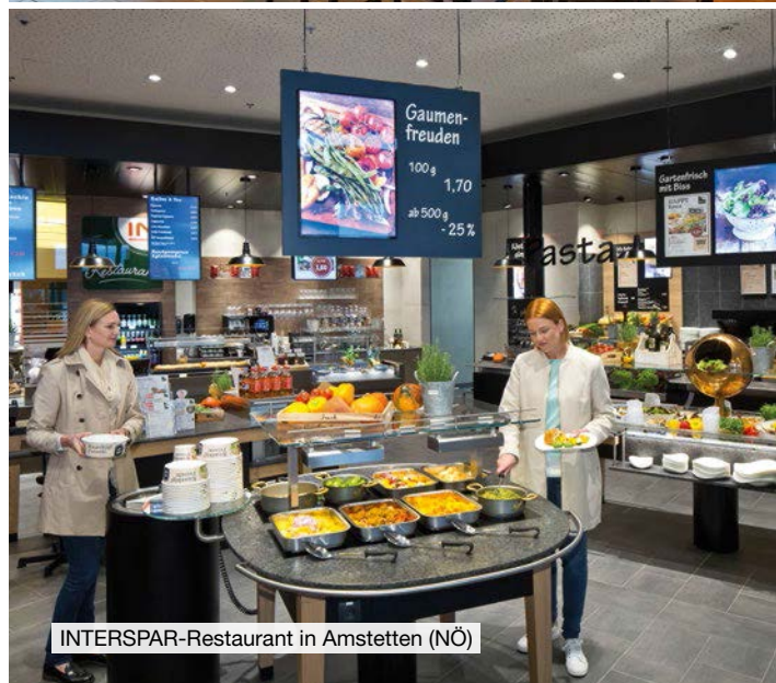
INTERSPAR-Restaurant in Amstetten (NÖ)